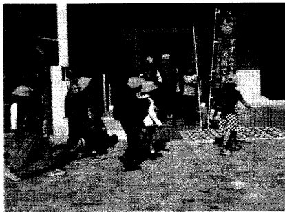
あいさつ運動週間

五月の「さわやか週間」では、「あいさつえお」の「あ・あかるいあいさつ」を目標に三～六年の代表児童が昇降口にて、あいさつ運動を行いました。みんな笑顔で元気にあいさつを交わし、清々しい気持ちで一日をスタートすることができました。この「油繩子小学校じまんのあいさつえお」を、機会あるごとにお話しすることで、さらによりよい油繩子小学校となるよう、教職員一丸となって取り組んでいきます。今後ともご理解とご協力をお願いいたします。