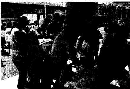
暑い中、ありがとうございました。

参加された方及び分別に協力された方の皆さんありがとうございました。来年も宜しくお願いします。