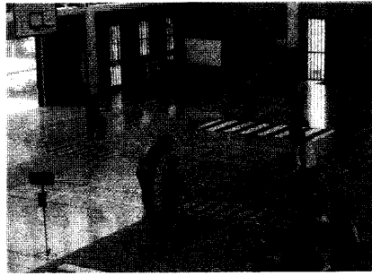
1年生の交通安全教室