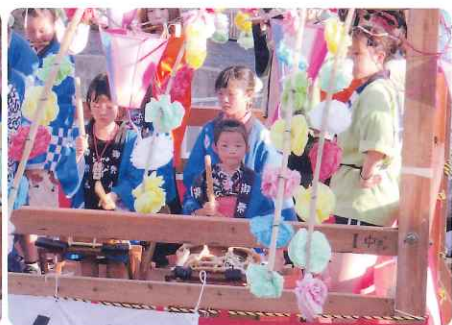
子供囃子の皆さんありがとう!