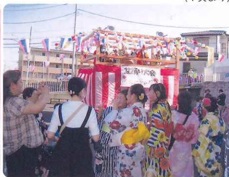
さあ 踊って下さいね!