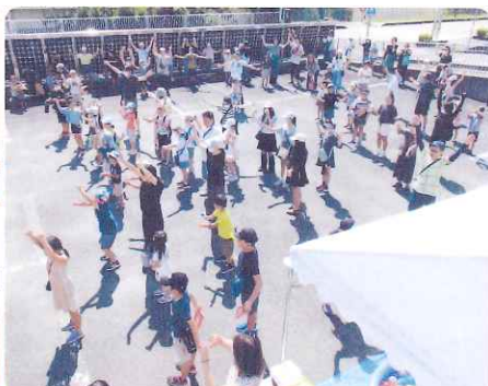
さあ 元気にラジオ体操!