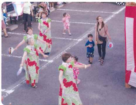
フラ・アロハの皆さんです!