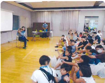
婦警さんとケンちゃんのお話面白いね!