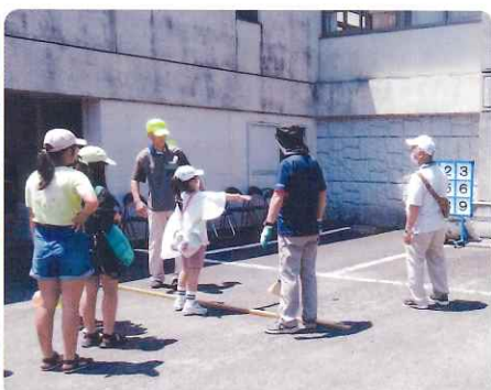
ストラックアウト 当たった!