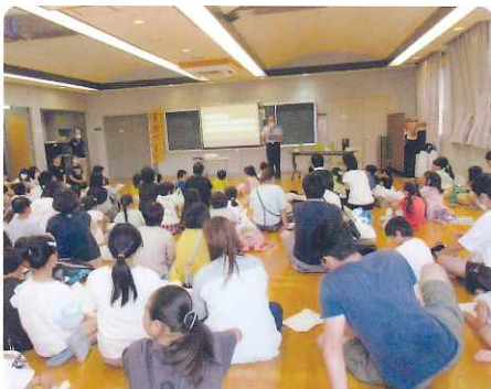
おまわりさんのお話よく聞いてね!