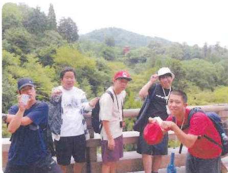
高等部 3年修学旅行・京都清水寺

これからの特別支援教育は「障害の有無に関わらず誰もがその能力を發揮し、共生社会の一員として共に認め合い、支え合い、誇りを持って生きられる社会の構築を目指す。」としています。本校においても、自分の能力を最大限に發揮させ、一人一人が輝く学校づくりに今後もしっかり組んでいきたいと思えます。地域で育ち地域で自立していく子どもたちを、今後も応援してまいりますようお願いいたします。