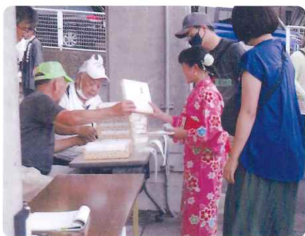
はい おめでとう!(抽選会)