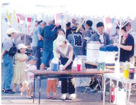
シロップ何にする?