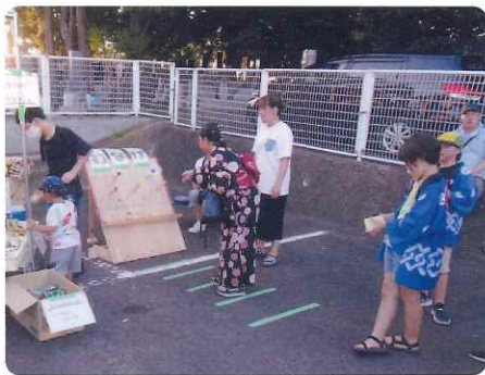
輪投げ 入った入った!