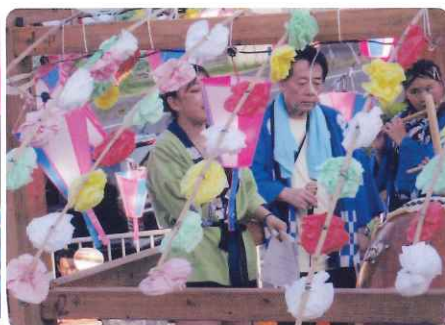
張り切っております!