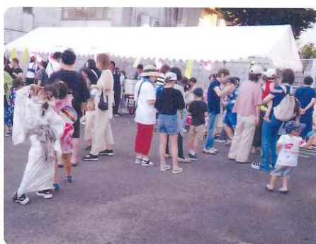
にぎわう模擬店前