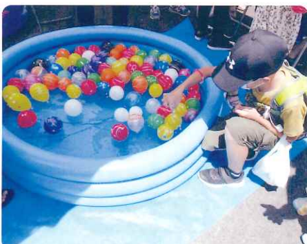
ヨーヨー 静かに上げてね!