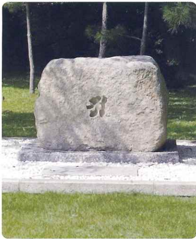
移設された四つ塚

太田への往還の宿舎として利用され「忠次郎殿出張の宿舎」と称されたという。空堀の中に水の湧出している場所がある。城館としての大切な水源であつたのか。また、近年「四つ塚」の碑が入り口の左側に設置された。昭和十三年、旭町社建設地(昔の地名四つ塚)の四つの塚から古い人骨が見つかった。これも孫沢合戦に結び付けてあつた。が、ヨークベニマルの店舗建設に伴い、現在地に移設されたものである。