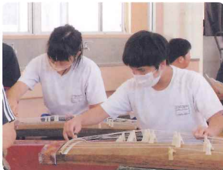
中学部 音楽事業・琴体験